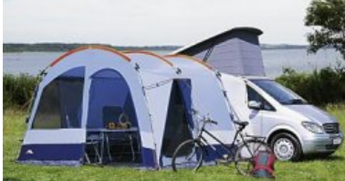
dwt Sprint Bus-Vorzelt

für Busse mit Regenrinnenhöhe von 180–220 cm Große Eingänge in den Seitenwänden, komplett mit Gaze ausgestattet, und die bequem mit Reißverschluss einziehbare Bodenwanne bieten Komfort und viel Bewegungsfreiheit. Die stabile Gestängekonstruktion garantiert Standfestigkeit, farblich abgesetzte Gestängekanäle sorgen für einen angenehmen Akzent. Maße:Zelttiefe: ca. 280 cmZeltbreite: ca. 350 cm