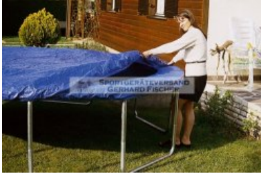
Wetterschutzhülle für Fun 24